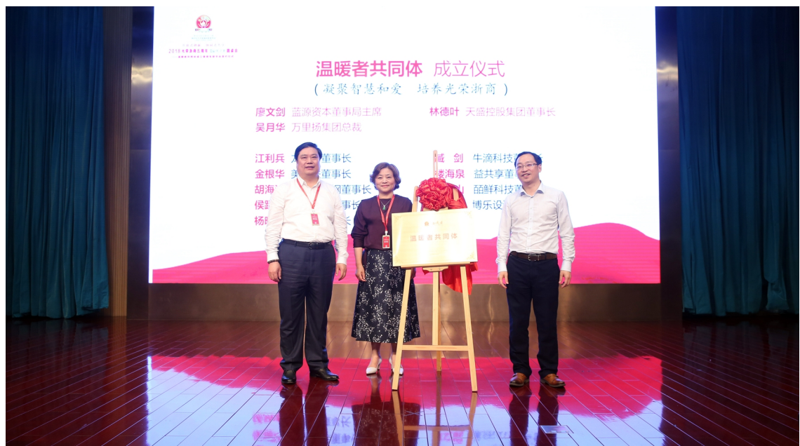
温暖者共同体 成立仪式 (凝聚智慧和爱 培养光荣浙商)