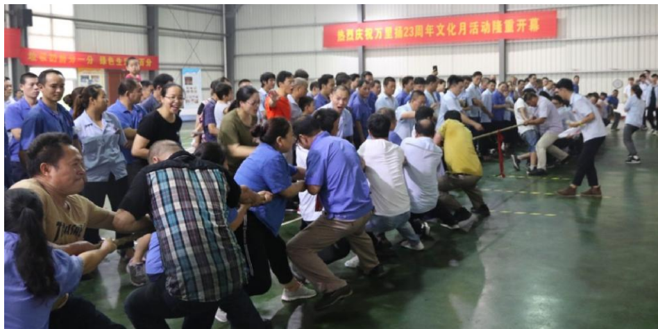
《文化活动好戏连台》

7月,一年一度的万里扬文化月如期而至。几十项文艺类和技能类活动陆续开展,极大丰富了广大员工的文化生活,促进了员工相互间的交流,提升了技能操作水平,增强了团队的凝聚力和向心力。