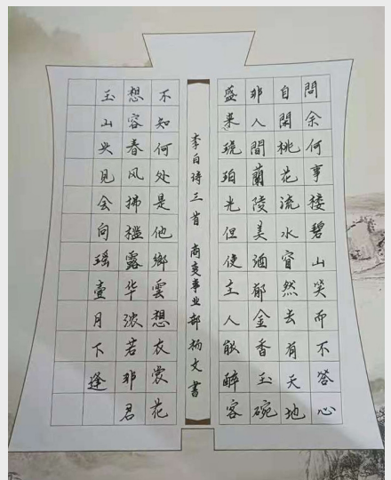
《诗三首》 商变总装厂 杨文