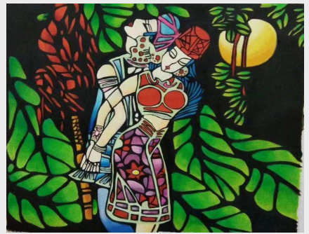
《民族风情》 齿轮二厂 李延娟