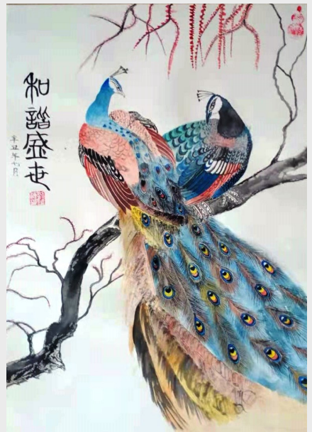
《和谐盛世》 齿轮二厂 刘荷海